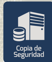
Copia de Seguridad