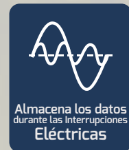
Almacena los datos durante las Interrupciones Eléctricas