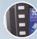
Botones de función