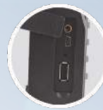
Puerto USB y salida para parlante externo