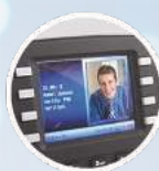
Foto-ID (Pantalla 3.5" TFT)